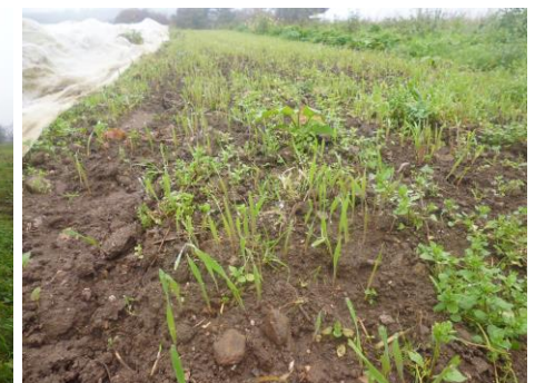
Le Seigle au bout de 6 jours

Nous avons choisi deux types d'engrais vert adaptés à la période de semis (fin octobre) : l'avoine et le seigle. L'avoine vient de l'Union Française d'Agriculture Biologique (U.F.A.B.), le seigle de l'entreprise « Du Grain au Pain » à Ergué Gabéric.