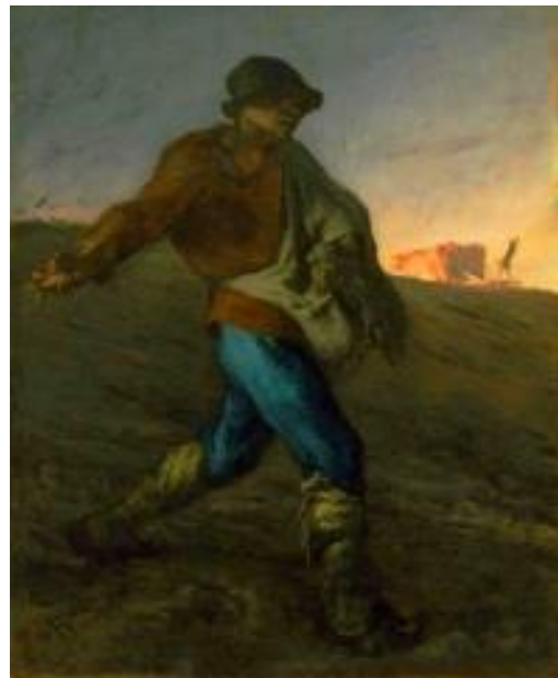
“Le Semeur” par Millet (1850)

Le geste des semailles restera un des plus symboliques de l'homme intégré à la nature. Mouvement régulier comme le balancier d'une horloge, il évoque la mesure du temps, l'union avec le milieu et la ferveur dans la vie future. Geste de toute éternité, c'est plus qu'une technique, c'est un art et un rite. Elan chargé d'émotion que Victor Hugo a fixé dans la mémoire collective :